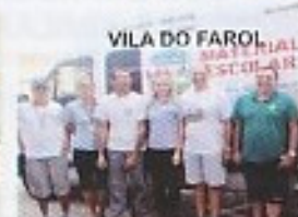
VILA DO FAROL