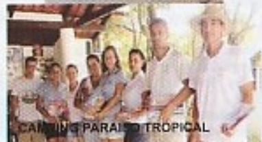
CAMPING PARAÍSO TROPICAL