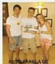
REST. PANELA DE BÊGO