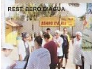
REST. BERO D'ÁGUA