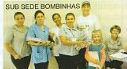
SUB SEDE BOMBINHAS