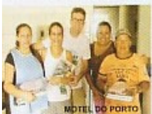
MOTEL DO PORTO