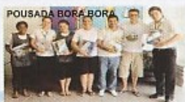
POUSADA BORA BORA