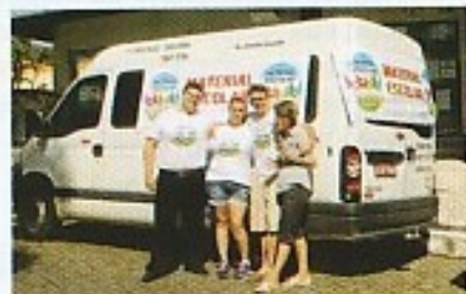
VAN COM FUNCIONÁRIOS DO SINDICATO